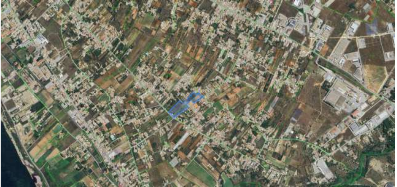
Figura 2 Immagine satellitare con individuazione del lotto