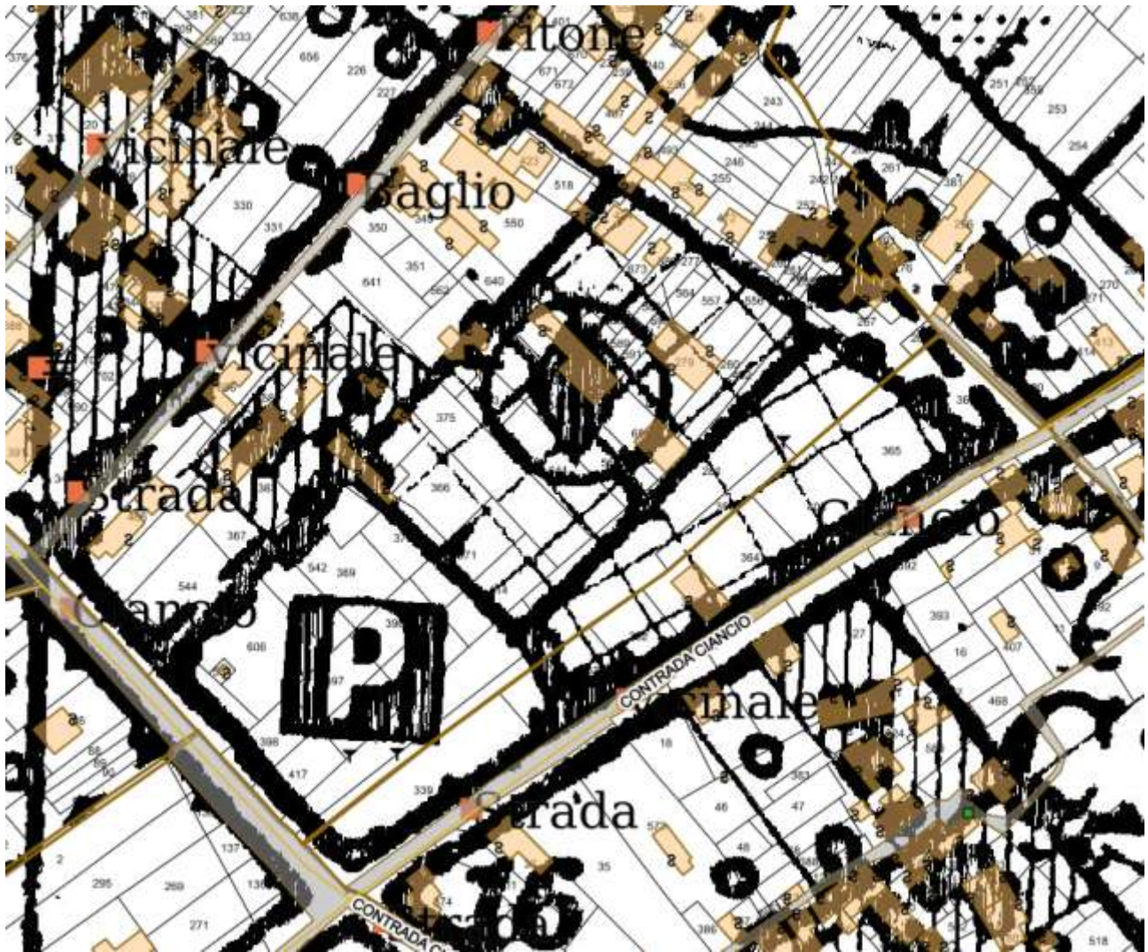
Figura 6 Stralcio del Piano Comprensoriale n. 1 Tav. 17 con sovrapposta la cartografia catastale