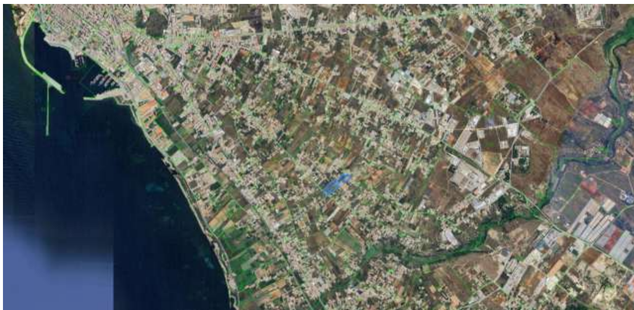
Figura 1 Immagine satellitare con individuazione del lotto