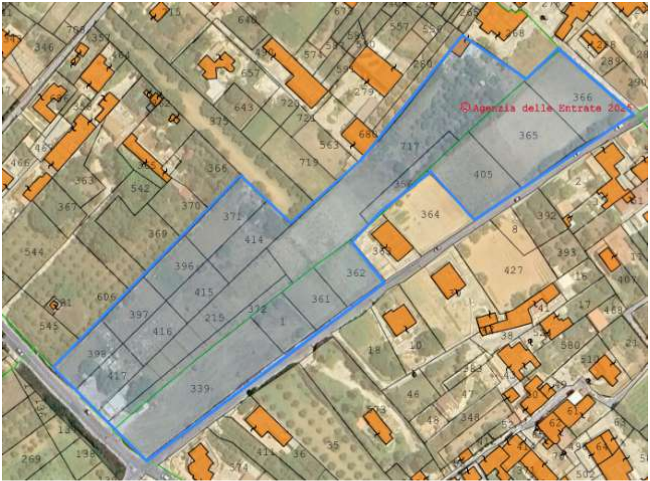
Figura 4 Immagine satellitare con individuazione del lotto con sovrapposta la cartografia catastale (la particella 366 del foglio di mappa 261 è interessata solo parzialmente).