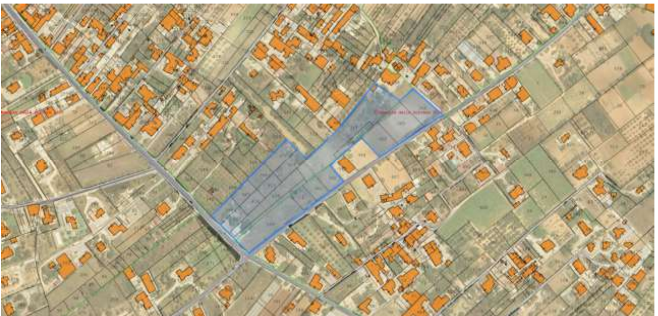
Figura 3 Immagine satellitare con individuazione del lotto con sovrapposta la cartografia catastale